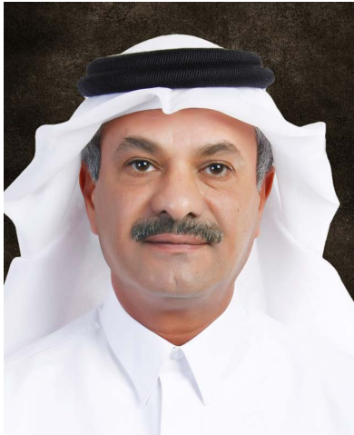
فهد بن محمد بن جبر آل ثاني رئيس مجلس الإدارة

كما يمتلك البنك أيضاً شركتي الدوحة للتمويل المحدودة وبنك الدوحة للأوراق المالية المحدودة، وهي مسجلة في جزر الكايمان، وكذلك شركة شرق للتأمين مسجلة في مركز قطر للمال، وهي جميعها شركات تابعة مملوكة للبنك بالكامل، بالإضافة إلى حصة استراتيجية بنسبة 35.29% من رأس مال إحدى شركات الوساطة الهندية تسمى بشركة الدوحة للوساطة والخدمات المالية وتمارس نشاطها في أعمال الوساطة وإدارة الموجودات.