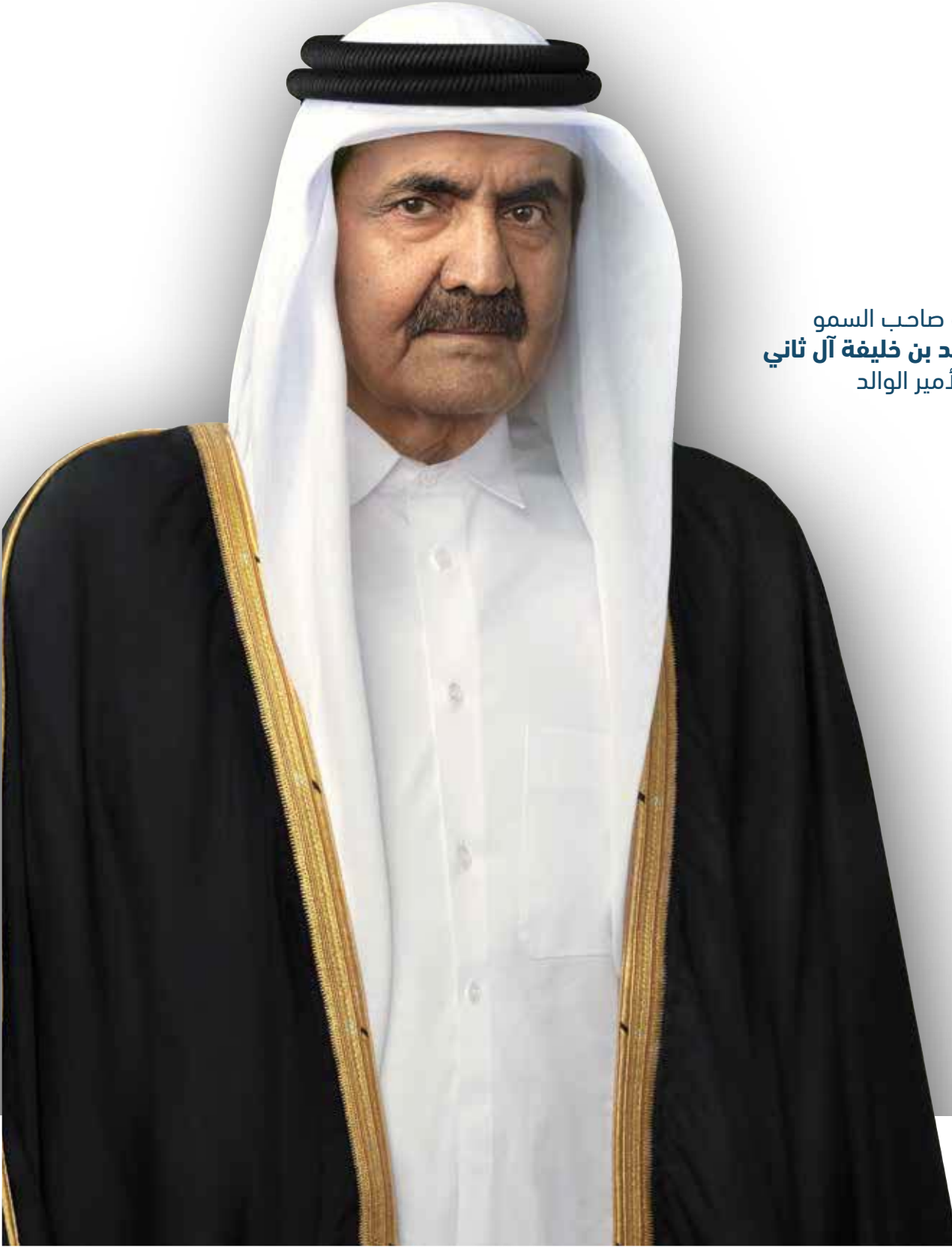
حضرة صاحب السمو الشيخ حمد بن خليفة آل ثاني الأمير الوالد